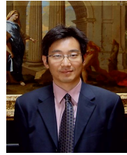
School of Management Fudan University