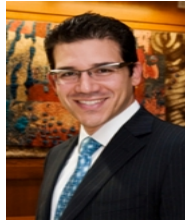
Boston College Carroll School of Management